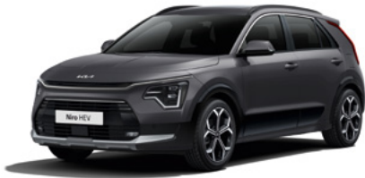
Interstellar Grau Metallic (AGT)