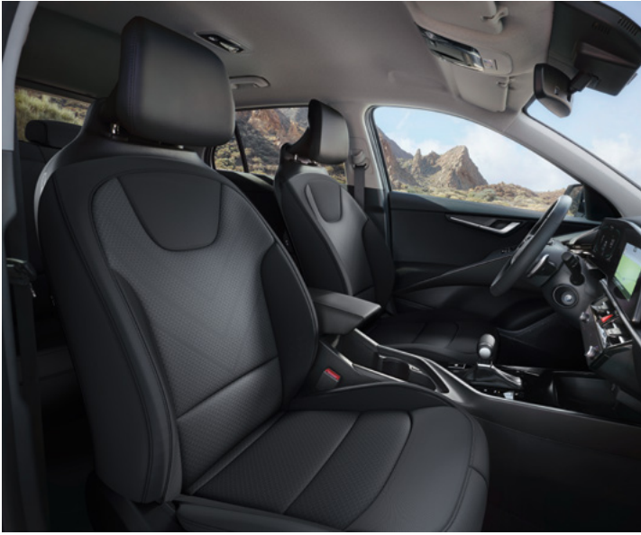
Sitzbezüge in Stoff, Charcoal (CCV) (Edition 7)

Im Innenraum des Kia Niro kommen sorgfältig ausgewählte Materialien zum Einsatz, damit du dich vom ersten Moment an wohlfühlst. Je nach Ausstattungsvariante stehen für die Sitze Bezüge in Stoff, Stoff-Leder-Kombination (mit hochwertiger Ledernachbildung) oder Leder kombiniert mit hochwertiger Ledernachbildung zur Wahl.